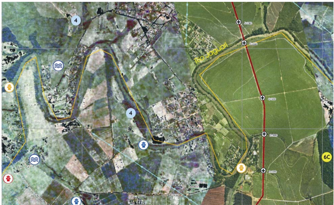
Figura 2. Exemplo de Elementos Ambientais em Área Urbana

A identificação dos elementos ambientais sensíveis localizados ao longo do traçado do duto e dos cursos d'água, facilita a focalização dos pontos críticos, isto é, aqueles que em caso de vazamento do óleo serão prioritariamente protegidos, propiciando um melhor direcionamento das ações de contingência.